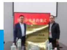
学院与共青城跨境电商产业园 签订校企合作