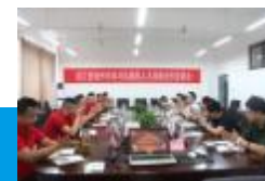
学院与浙江省湖州市南浔区 举办人才战略交流会