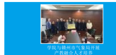
学院与赣州市气象局开展产教融合人才培养

防雷检测技术岗、防雷检测服务岗、雷电防护产品测试技术岗、防雷工程设计工程师、监理工程师、智慧雷电监测预警系统工程师及智慧雷电防护产品的生产与销售等。