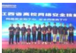
学院在江西省 高校网络安全技能大赛中斩获佳绩