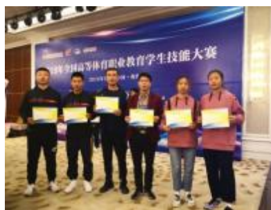
学生在2019年全国高等体育职业技能赛场荣获佳绩

面向体育行业、健康服务行业的保健服务人员、健身和娱乐场所服务人员、健康咨询服务人员职业群（或技术领域），运动康复训练师等应用型专业技术岗位。