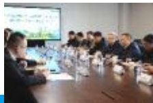
省教育厅、省气象局带队赴东软教育科技集团调研