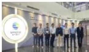
学院与深信服公司校企合作

物联网系统的安装、调试、维护岗位；物联网移动平台开发岗位；物联网系统的技术支持、销售岗等应用型专业技术岗位。