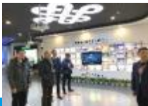
学院与科大讯飞股份有限公司签订校企合作战略合作协议