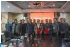
学院领导与软件系负责人赴江西联通调研