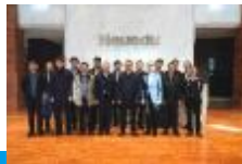
省教育厅、省气象局带队赴东软教育科技集团调研

人工智能应用产品开发与测试、数据处理、人工智能系统运维、人工智能产品营销、大数据运维等应用型专业技术岗位。